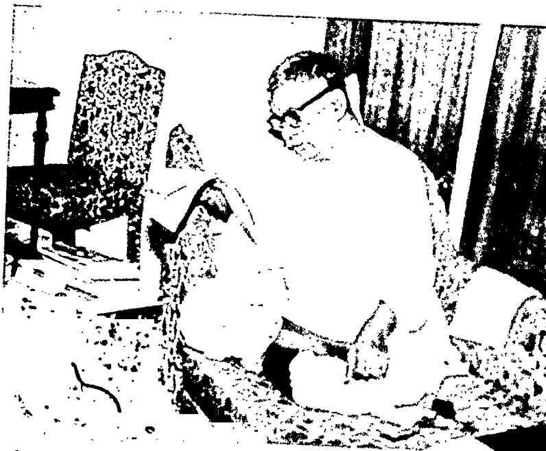
सादगी की मूर्ति